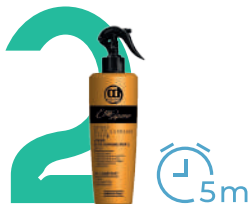
Спрей Elite Supreme

Распылить, проработать пряди руками. Не смывать.