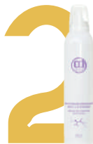
Восстанавливающий мусс с отрубями