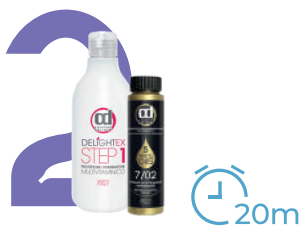
Краситель 5 Magic Oils и 3% окислитель (1:2), Delightex Step 1