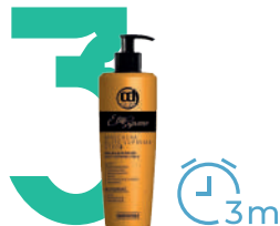
Маска Elite Supreme

Распылить, проработать пряди руками. Не смывать.