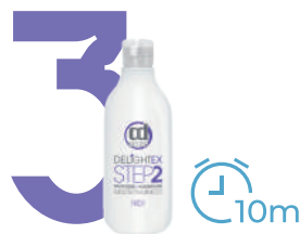
Delightex Step 2